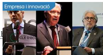
Les elits barcelonines ja no tenen qui les estimi