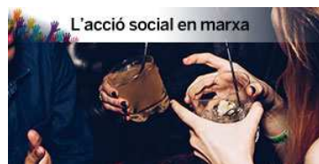
Les demandes d'ajuda a Projecte Home creixen un 15% els últims dos anys, sobretot per cocaïna i alcohol

Subscriu-te Afegeix Disqus Afegeix Disqus Afegeix No venguis les dades